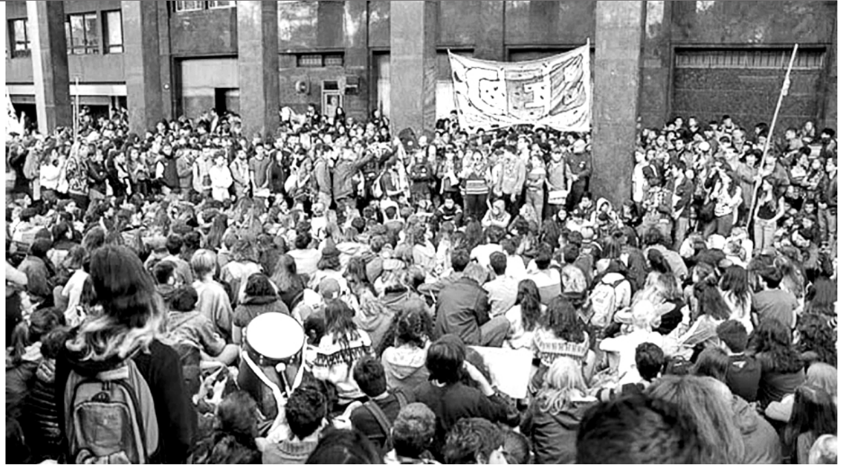
Los secundarios tomaron más de treinta colegios y marcharon masivamente el 6, el 15 y el 22 de septiembre

El gobierno combinó un retroceso en los objetivos que públicamente plantea para la reforma con una intensificación de la violencia institucional y mediática contra la organización estudiantil. Varios periodistas se sumaron a la ola reaccionaria contra las tomas.