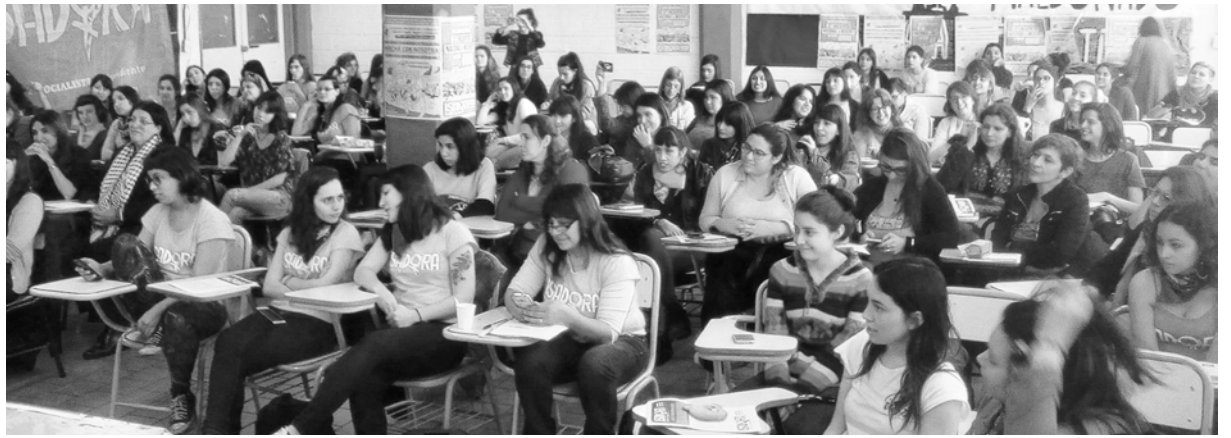
Se dieron importantes debates durante el preencuentro de Isadora