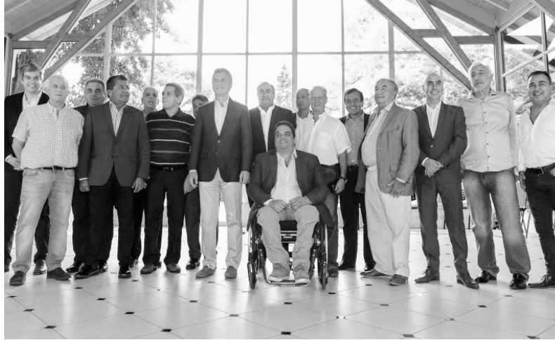
El gobierno y la burocracia sindical negocian la continuidad del ajuste

Pero, como dice el dicho, “todavía falta lo mejor”. Efectivamente, el gobierno de Cambiemos ha “guardado” una nueva etapa, superior, de