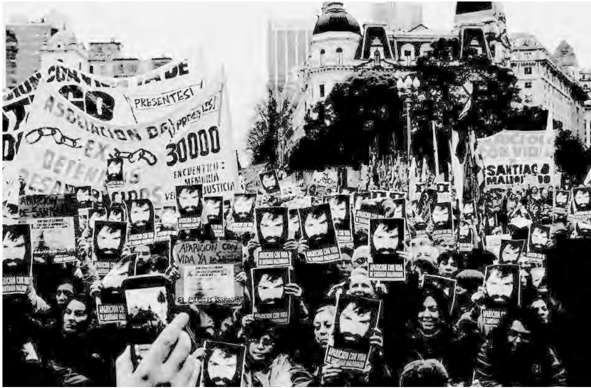
El 1° de octubre llenaremos nuevamente Plaza de Mayo y las plazas del país por Maldonado

Al día de hoy el presidente Macri insiste en sembrar sospechas sobre los mapuches mientras calla