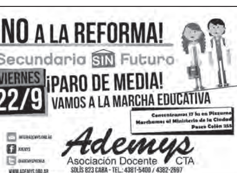
El sindicato docente combativo Ademys impulsó el paro y la movilización del 22 de septiembre

Otro tanto sucedió a nivel estudiantil. Incluso la agrupación Simón Bolívar con importante