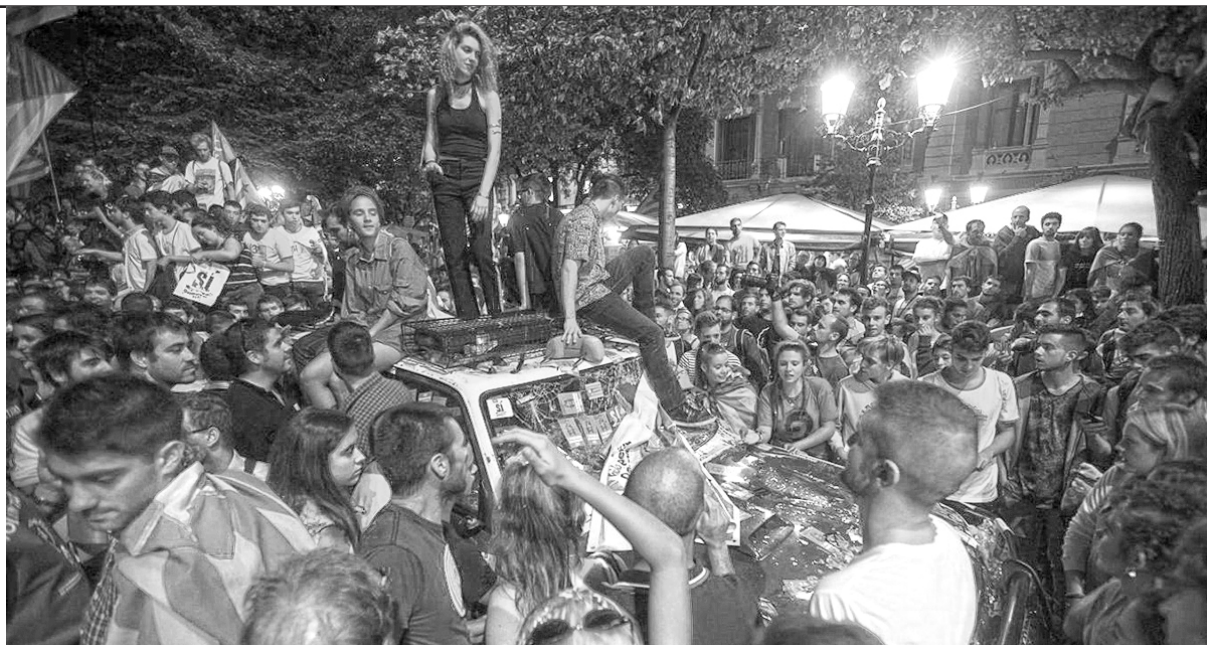
Manifestantes sobre un patrullero, en las afueras de la Consejería de Economía, repudiando el allanamiento

Rajoy creó un organismo de coordinación policial específico contra el independentismo, con instrucciones de continuar los allanamientos para secuestrar todos los materiales del referendo, ha apelado a la censura para intentar controlar la situación, así como a la persecución judicial de los independentistas. El Tribunal de Cuentas incluso abrió una investigación por malversación de fondos a nueve impulsores del anterior referendo, realizado en noviembre de 2014. Los fiscales al servicio de Rajoy también han llamado a funcionarios de 31 ayuntamientos a declarar sobre su apoyo al referendo del 1º de octubre, y dejan abierta la posible detención de Puigdemont, el jefe del gobierno autonómico. Los reformistas de Izquierda Unida se unen al régimen contra el referendo,