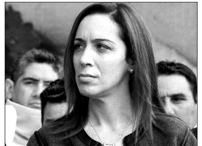
Vidal ejecuta el ajuste de Macri en Buenos Aires

Vidal denuncia a las mafias y habla el combate de la inseguridad haciendo de esto un eje de su gestión. Pero las comisarías siguen funcionando como aguantaderos donde la plata del juego clandestino, la prostitución y el narcomenudeo rebasa las cajas fuertes y escritorios de los comisarios, mientras las zonas liberadas